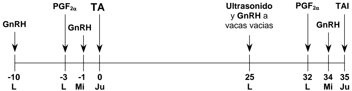
Figura 2. Protocolo de manejo reproductivo que combina IA programada (Ovsynch) con diagnóstico temprano de preñez usando ultrasonido. Nótese que las inyecciones de hormonas son programadas para el lunes (L) y miércoles (Mi), exámenes de ultrasonido para lunes (L), e IA programada (TAI) para el jueves (Ju). El promedio de intervalo entre servicios sería de 35 días para vacas que requieren resincronización.

para resincronización con Ovsynch. Esto resultaría en un intervalo entre servicios de 35 días para vacas que necesiten resincronización.